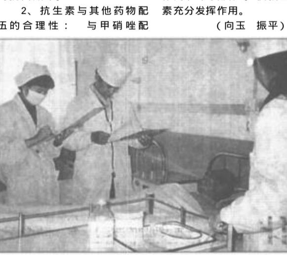
日前，广饶县稻庄镇卫生院投资20万元建起了急救中心、规范化病房，购进了不锈钢病床116套，安装床头呼叫器20个，大大改善了医疗条件。本版责任编辑 王海林

伍；与中草药剂剂伍；联合应用抗生素。3、抗生素的疗效与人体综合表现：药物疗效是药物与人体相互作用的综合表现，药物对某一具体的病原菌来说，如果病原菌对所选择药物敏感，疗效就好。临床资料证明；实验药敏作为临床用药的重要参考。而认为药物越贵，疗效越好的观点是没有科学依据的。因此，正确合理应用抗生素，临床用药选敏感、广谱、廉价抗生素，尽量做到根据细菌培养和药敏试验选药，防止滥用和泛用，不做预防用药，以减少毒副作用和不良反应。使抗生素充分发挥作用。(向玉 振平)