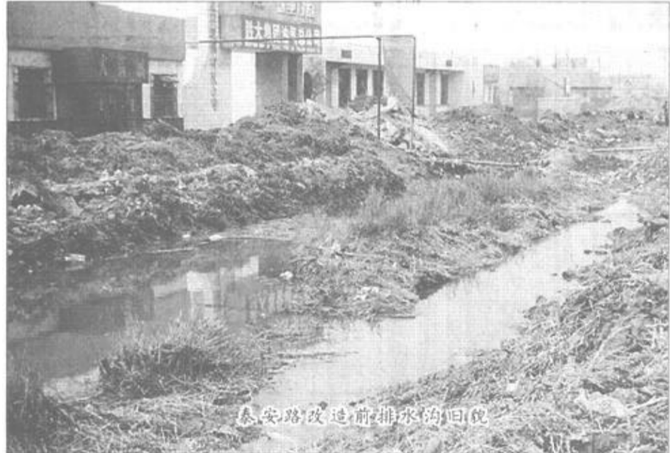
泰安路改造前排水的归位

1968年，为了方便胜利油田的勘探会战，在建成东辛路之后又分段修筑了博（兴）——永（安）路，泰安路便是其中的一段（基地——八分场），当时的路面宽仅有6米，但在当时已是“现代”的了。由于泰安路的通车，胜利油田的许多单位都沿路而建，以享受“大马路”带来的便利。主要单位有：供水公司、石油学校、东辛一矿、测井公司、保温材料厂、科研新村、建工新村、工农村、东辛作业队、工农一村、丰收村、钻井农副业三大队、胜利医院。我国最著名的石油大学也坐落在泰安路西端的南侧。可以说，泰安路为胜利油田的开发建设做出了很大的