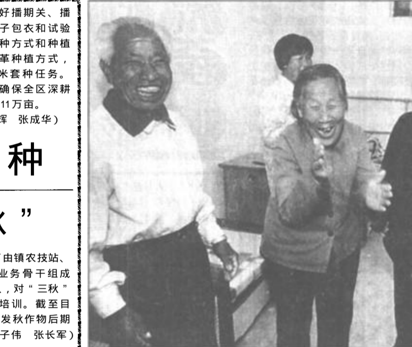
广饶县稻庄镇党委、政府重视敬老院建设，先后投资68万元，新建高标准宿舍31间，实行统一供暖，配备了茶水炉、电视机、VCD，每个房间都配置了电风扇、沙发等生活设施，并下大力气进行了绿化，老人们在这环境优美的“家”里，生活得幸福快乐。

做好职工的思想教育工作，最重要的就是要结合职工的思想实际，特别是针对造成职工中存在模糊思想认识的原因，才能做到有的放矢，提高教育的效果。首先，要树立思想问题最终要靠思想教育解决的信心。近年来，由于思想教育工作弱化，人们对它地位和作用的认知，出现了很大的偏差。从教育万能到教育无用，在实践中，都对思想工作造成了极大的损害。但是，思想认识问题，从归根结底的意义上说，重视和加强教育，是解决思想认识问题最重要、最彻底的途径。其次，营造“小气候”，是做好思想教育工作的有效方法。加强职工思想工作，需要一定的社会环境。企业党委和企业思想政治工作者有义务、有责任在本企业创设一种环境，形成一种教育氛围和舆论压力，使职工感受有形无形的思想教育。三是思想没有“真空”，科学的理论、正确的思想需要不断地灌输。近年来，个人主义、自由主义有滋长和封建迷信抬头的现象，特别是“法轮功”问题的深刻教训，都说明在思想教育弱化滞后的情况下，一些非马克思主义的东西就会乘虚而入，而这些现象的存在和发展，反过来又加重了思想教育工作的任务。“灌输”是马克思主义掌握群众的重要方法，重视和加强职工思想工作，就是要重视和充分发挥马克思主义的教化、熏陶、武装作用，坚定不移地用科学的理论武装群众，唱响时代的主旋律。